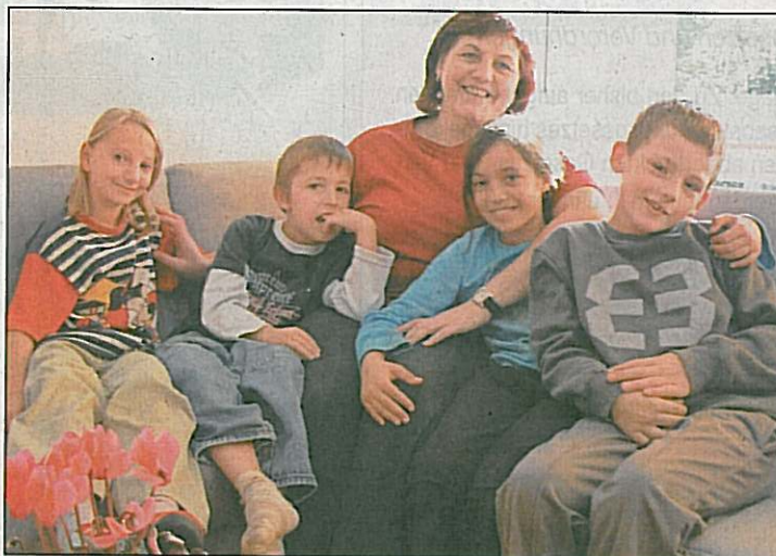
In insgesamt zehn Kinderdorf-Familien leben derzeit 68 Kinder und Jugendliche.